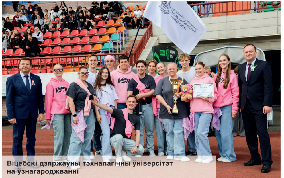
Віцебскі дзяржаўны тэхналагічны ўніверсітэт на ўзнагароджванні