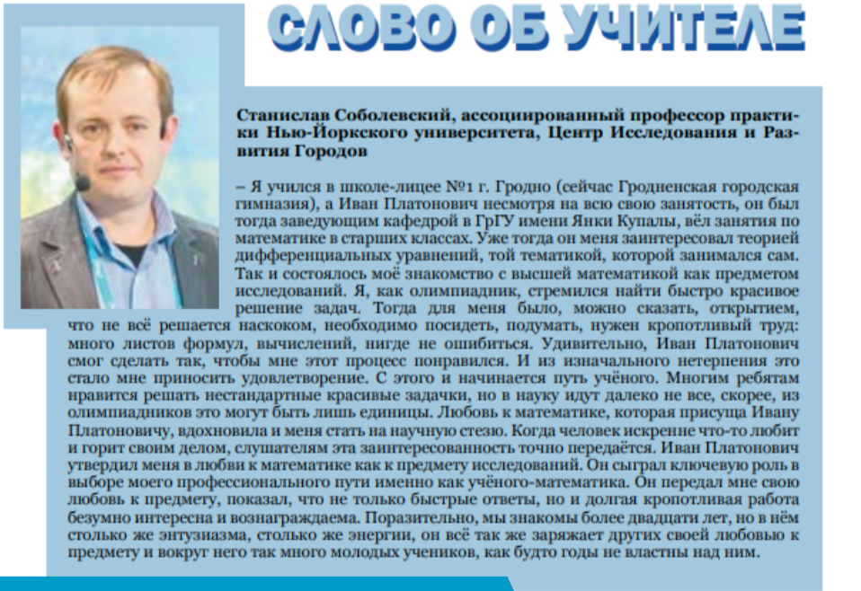
Фрагмент матэрыялу з газеты “Гродзенскі ўніверсітэт”, №7 (475) ад 5 верасня 2018 года

борніцтве – Нацыянальным конкурсе друкаваных СМІ “Залатая Літара” ў намінацыі “Лепшыя навуковыя матэрыялы раённых, гарадскіх, карпаратыўных і шматтыражных друкаваных СМІ”.