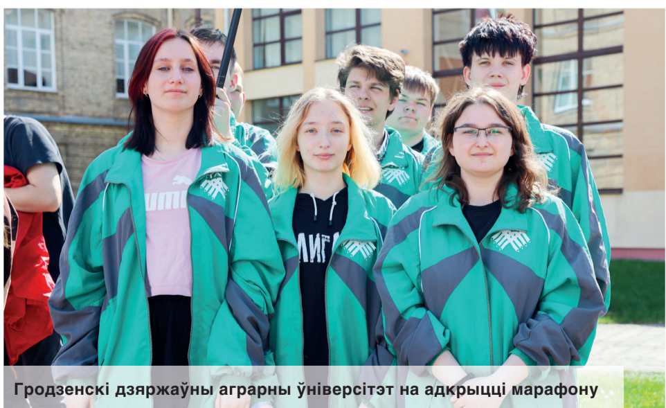
Гродзенскі дзяржаўны аграрны ўніверсітэт на адкрыцці марафону