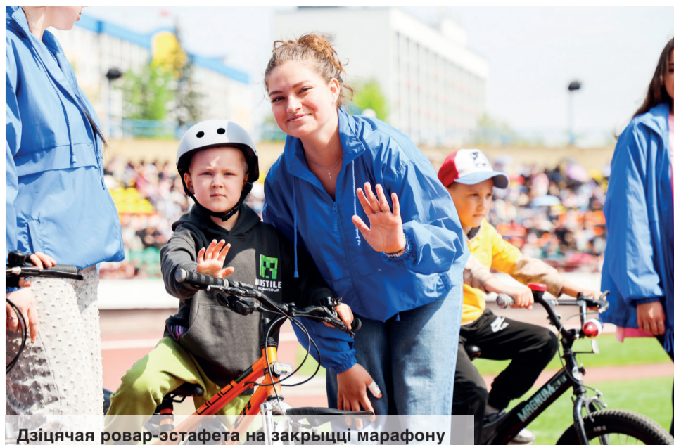
Дзіцячая ровар-эстафета на закрыцці марафону