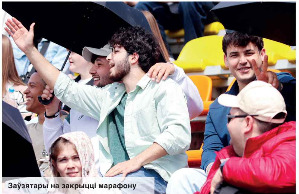
Заўзятары на закрыцці марафону