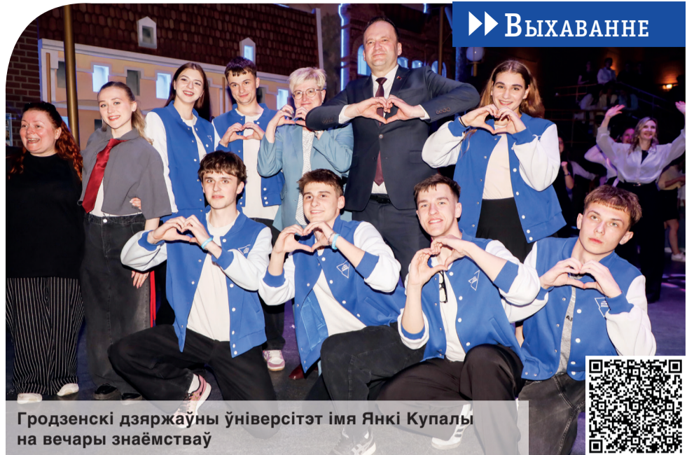
Гродзенскі дзяржаўны ўніверсітэт імя Янкі Купалы на вечары знаёмстваў

Анжالیка СЦЕФАНОВІЧ.