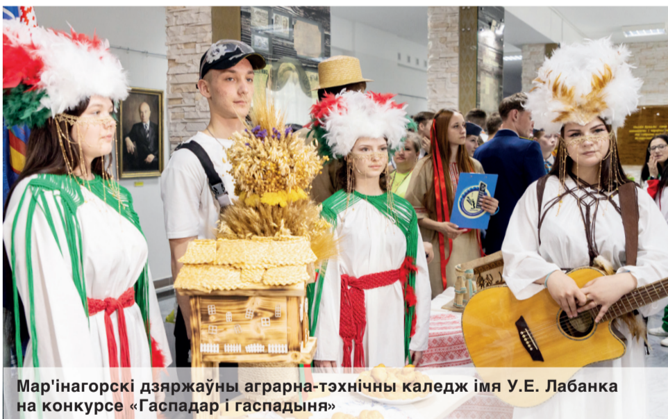
Мар'інагорскі дзяржаўны аграрна-тэхнічны каледж імя У.Е. Лабанка на конкурсе «Гаспадар і гаспадыня»