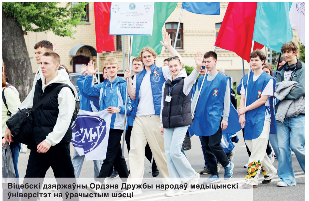
Віцебскі дзяржаўны Ордэна Дружбы народаў медыцынскі ўніверсітэт на ўрачыстым шэсці

▶ Студенткі ГрГУ сталі сярэбранымі прызерамі вайскова-патрыятычнага конкурсу «Я бы в армию пошла»