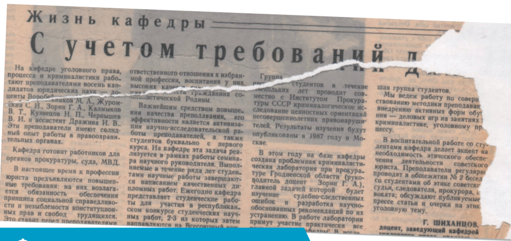
Фрагмент матэрыялу з газеты “Гродзенскі ўніверсітэт”, №10 (10) ад 14 кастрычніка 1986 года

Так, на першай паласе ў рубрыцы “Кароткім радком” надрукаваны матэрыял “Калі ласка ў магістратуру”, які паведамляе, што на базе ўніверсітэта адкрылася магістратура. “Тут праводзіцца навучанне па 9 спецыяльнасцях. Справа новая, але ўжо добра сябе зарэкамендала. Сёлета паступіла 18 заяў на 18 месцаў у магістратуры. Ужо на некаторыя спецыяльнасці аб’яўляецца конкурс. Самы вялікі – на эканамічныя спецыяльнасці” (“Гродзенскі ўніверсітэт”, ад 3 лістапада 1997 года, стар. 1).