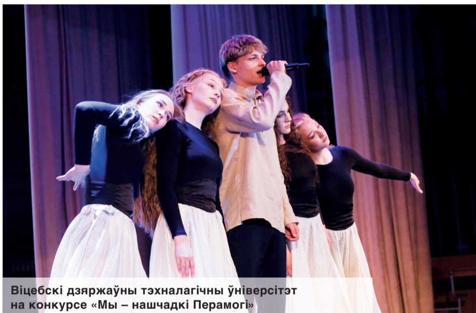
Віцебскі дзяржаўны тэхналагічны ўніверсітэт на конкурсе «Мы – нашчадкі Перамогі»