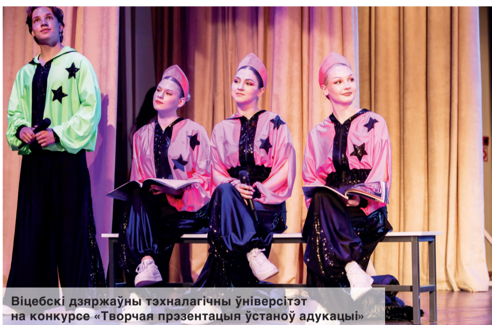
Віцебскі дзяржаўны тэхналагічны ўніверсітэт на конкурсе «Творчая прэзентацыя ўстановаў адукацыі»