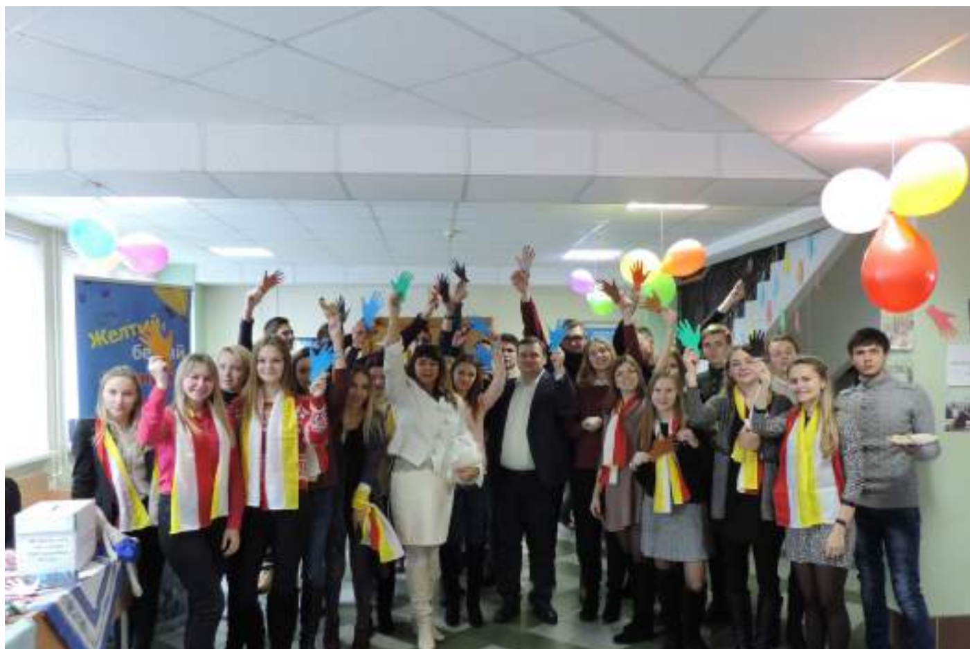
Благотворительная акция в поддержку детей из детских домов