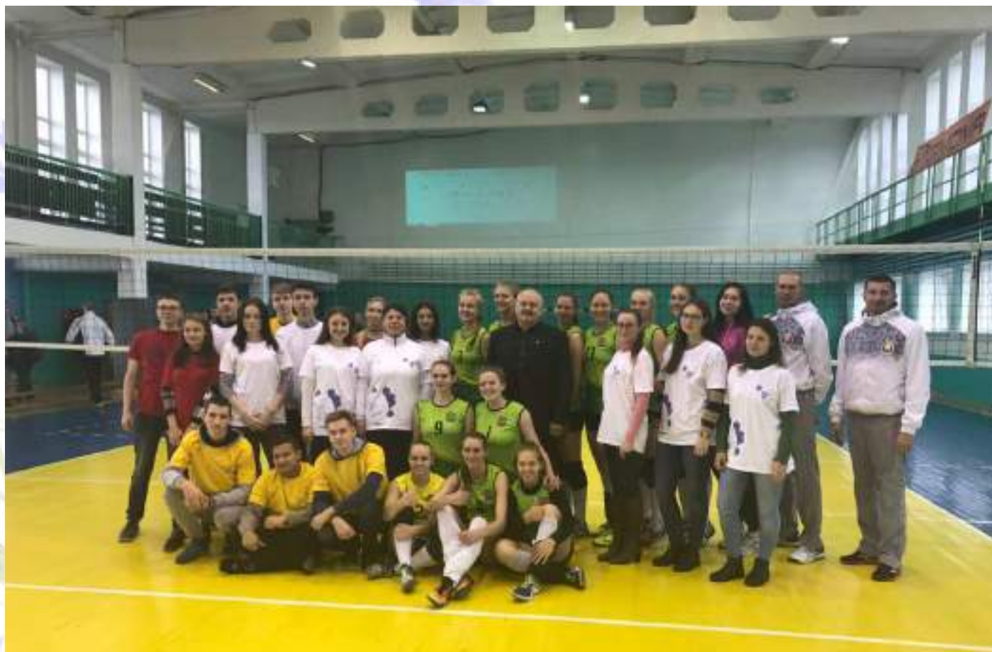
Актив ПО ГрГУ ОО «БСЖ» с женской волейбольной командой «Коммунальник-ГрГУ»