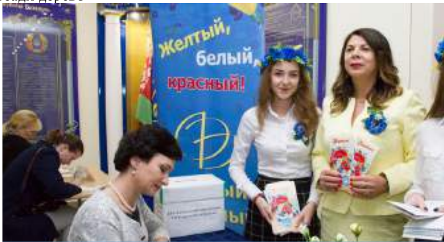
Пилотный проект Белорусского союза женщин университета «Открытка маме»