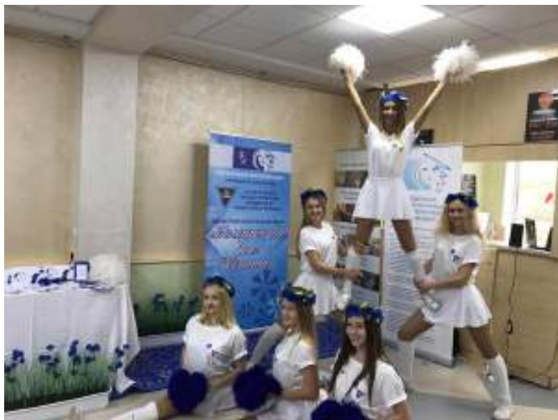
Выступление группы черлидинга ПО ГрГУ ОО «БСЖ» на встрече с Помощником Президента по Гродненской области Ровнейко С.В.

Ярким и креативным было выступление группы черлидинга ПО ГрГУ ОО «БСЖ» в рамках мероприятий, приуроченных к встрече Помощника Президента по Гродненской области С.В. Ровнейко с лидерами общественных объединений Гродненской области, на базе Гродненского медицинского университета.