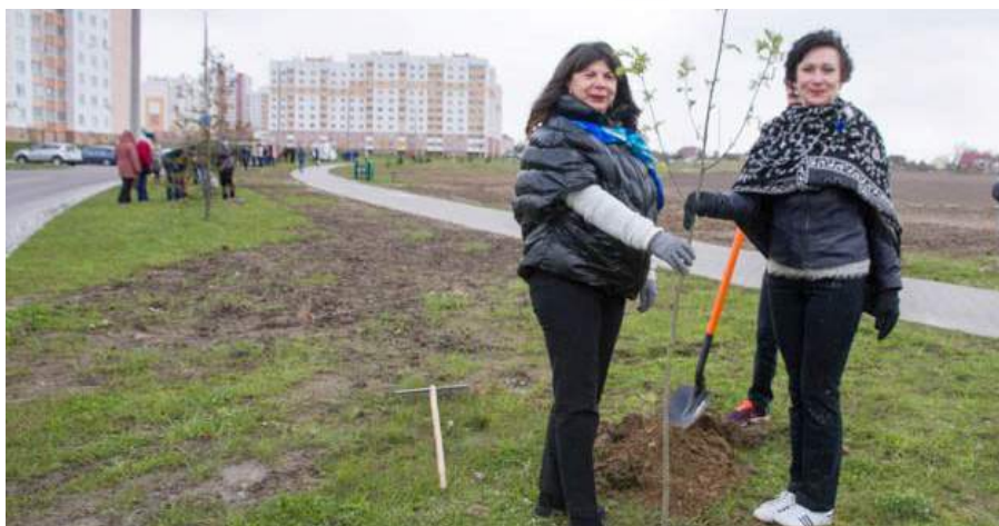
Актив ОО «БСЖ» во время закладки «Аллеи семьи купаловского университета»