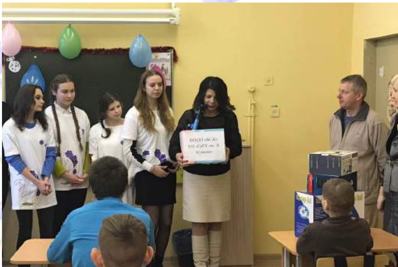
Подарки детям вспомогательной школы №1 г. Гродно от актива ПО ГрГУ ОО «БСЖ»