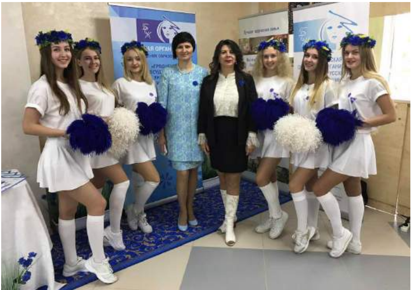
С членами первичной организации ГрГУ имени Янки Купалы ОО «БСЖ»