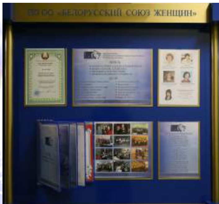
Стенд первичной организации ГрГУ имени Янки Купалы ОО «БСЖ»

За период работы председателем первичной организации ГрГУ имени Янки Купалы ОО «БСЖ» с 2016 г. проведено более 30 мероприятий с привлечением студентов, магистрантов, аспирантов, профессорско-преподавательского состава университета. Акции направлены на идеологическое, нравственно-духовное и патриотическое воспитание, на ведение здорового образа жизни и развитие волонтерского движения.