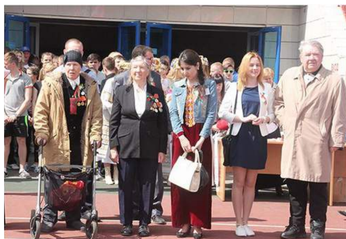
Гражданско-патриотический марафон «Вместе — за сильную и процветающую Беларусь!»

Совместно с Советом ветеранов Гродненской области представители "БСЖ" принимали участие в организации и проведении совместных мероприятий,