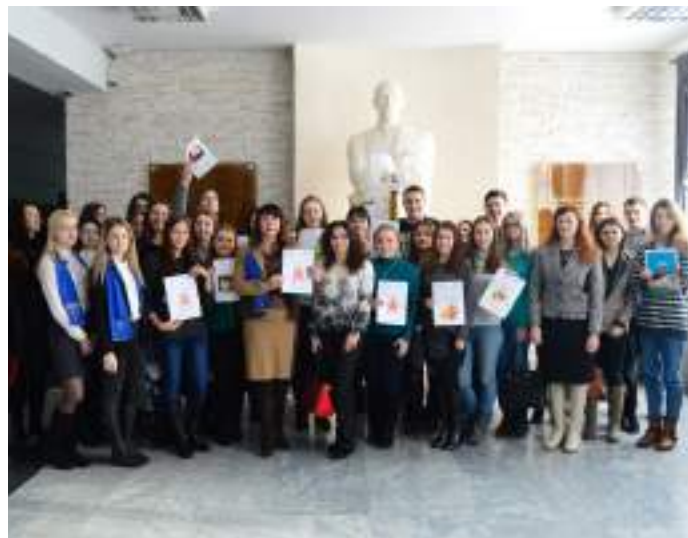
Участники проекта ОО «БСЖ» «Мой стиль жизни сегодня – мое здоровье и успех завтра!»