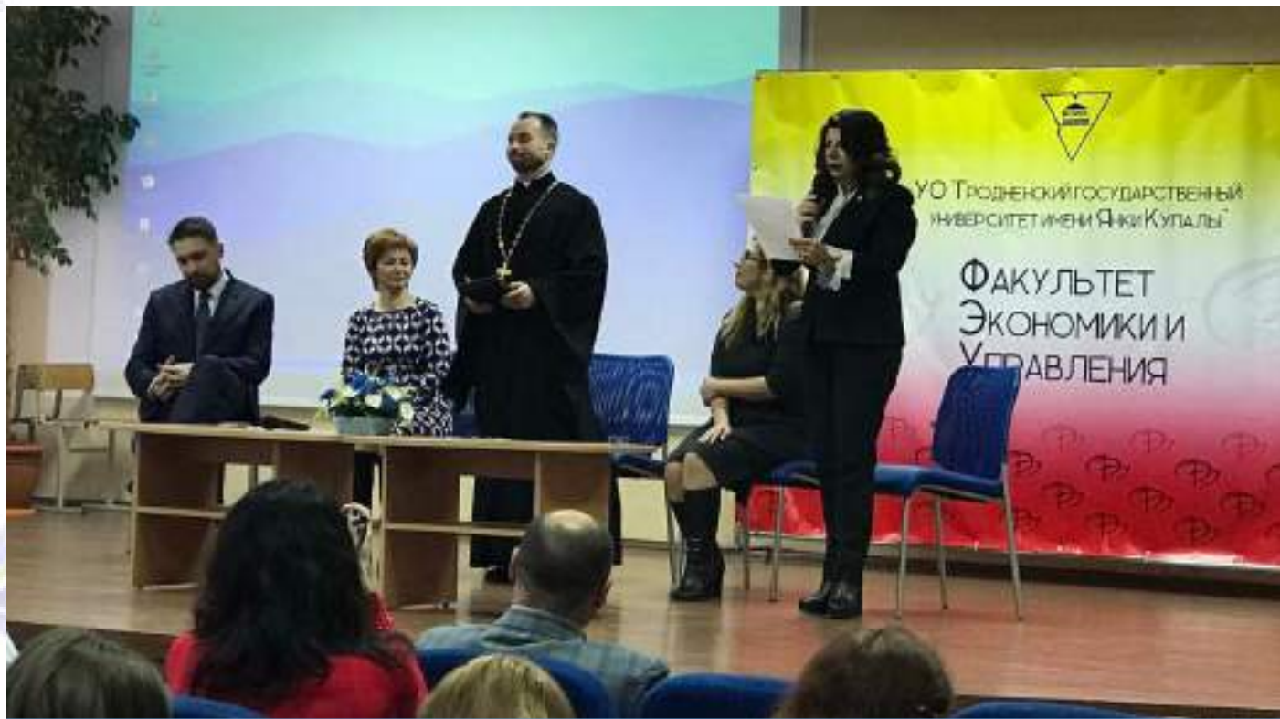
Участники семинара «Роль семьи в становлении личности: открытый диалог»