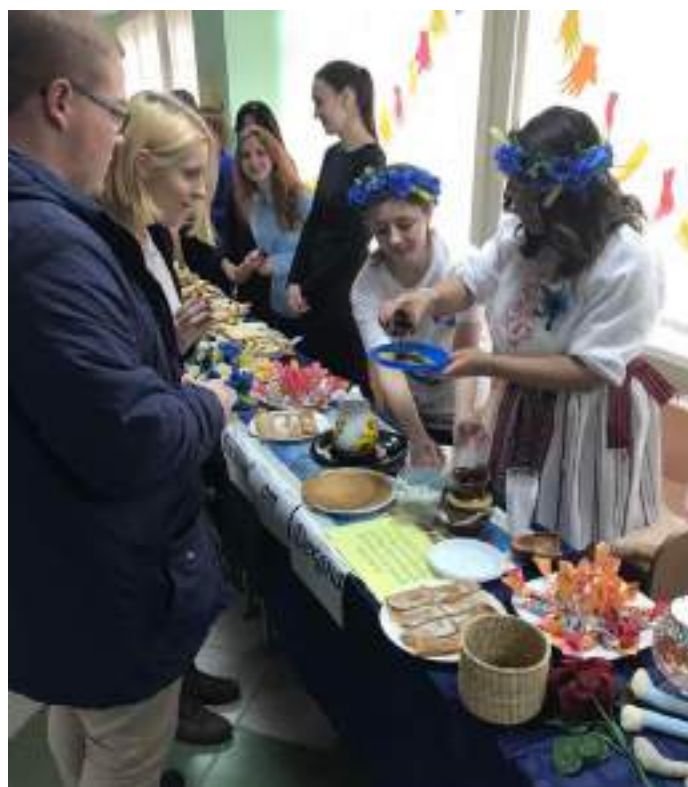
Рождественская ярмарка в купаловском университете

Во время акции 4 декабря 2017 г. в данной школе представители ОО «БСЖ» вместе с детьми делали новогодние открытки. Члены первичной организации приняли участие и в других благотворительных акциях: «Письмо Деду Морозу», «Тайный Санта», «Стань Дедом Морозом – осуществи детскую мечту». Творческое перевоплощение участников акции позволило детям стать немного счастливее и поверить в рождественское чудо.