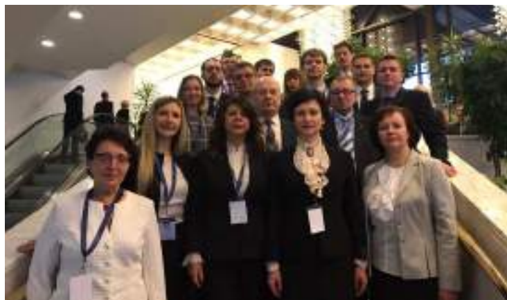
В составе делегации ГрГУ имени Янки Купалы на II съезде ученых Республики Беларусь