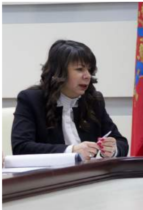
На встрече с представителями Гродненского городского исполнительного комитета

Члены "БСЖ" участвуют в реализации программ ГПНИ, БРФФИ и прикладных НИР по заказам предприятий, руководят НИР по государственным научным программам.