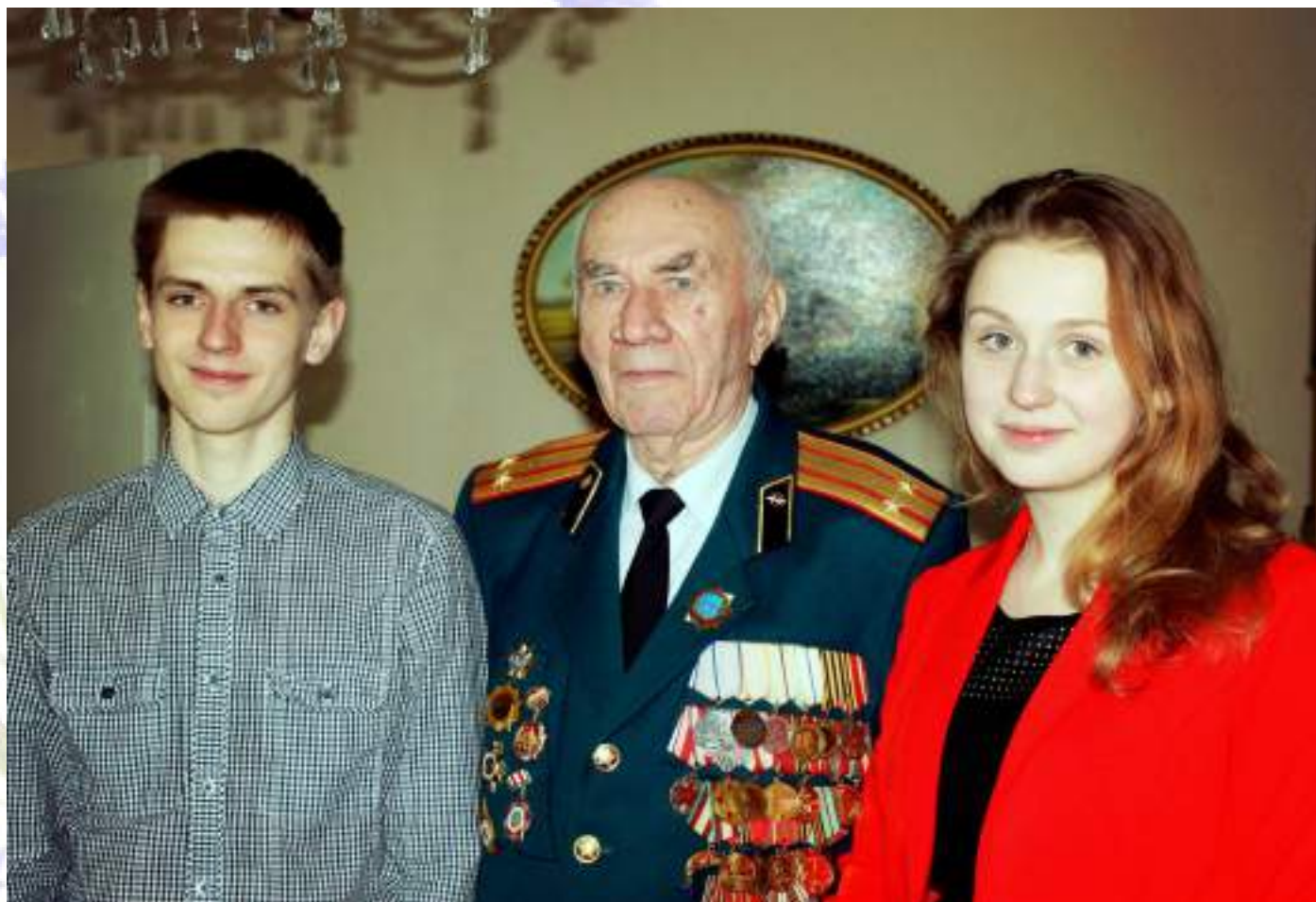
Чествование ветеранов ко Дню пожилых людей в рамках акции «Золотой возраст»

посвященных Дню пожилых людей — «Золотой возраст», а также была организована акция «Поздравительная открытка», где чествовали ветеранов цветами и открытками.