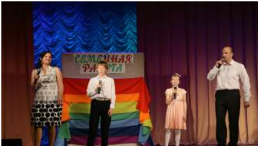
Участники родительской конференции «Мы вместе»

Уже дважды прошла акция «Открытка маме», которая является пилотным проектом Белорусского союза женщин университета. Акция приурочена к Международному Дню матери, который ежегодно отмечают 14 октября. В рамках мероприятия студенты и преподаватели смогли написать теплые пожелания своим мамам на открытке и отправить ее домой.