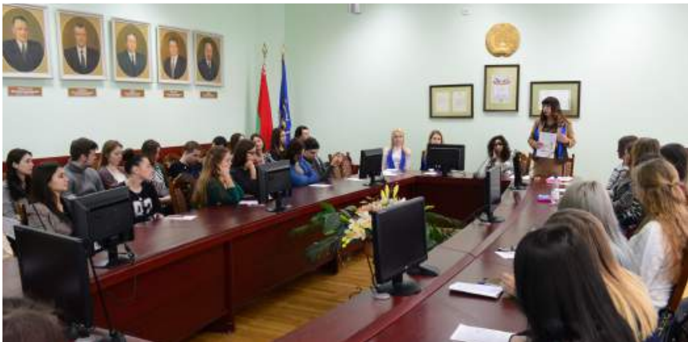
Участники проекта «Эффективный лидер»