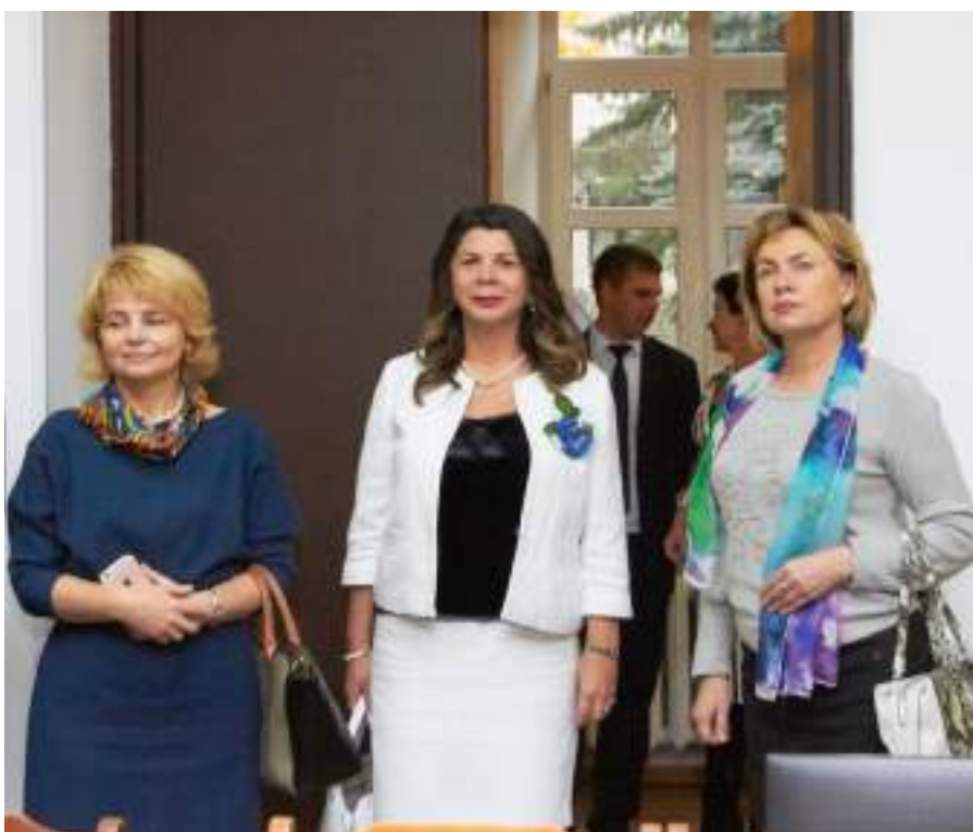
Участники выездного заседания президиума ОО «БСЖ» Республики Беларусь в купаловском университете